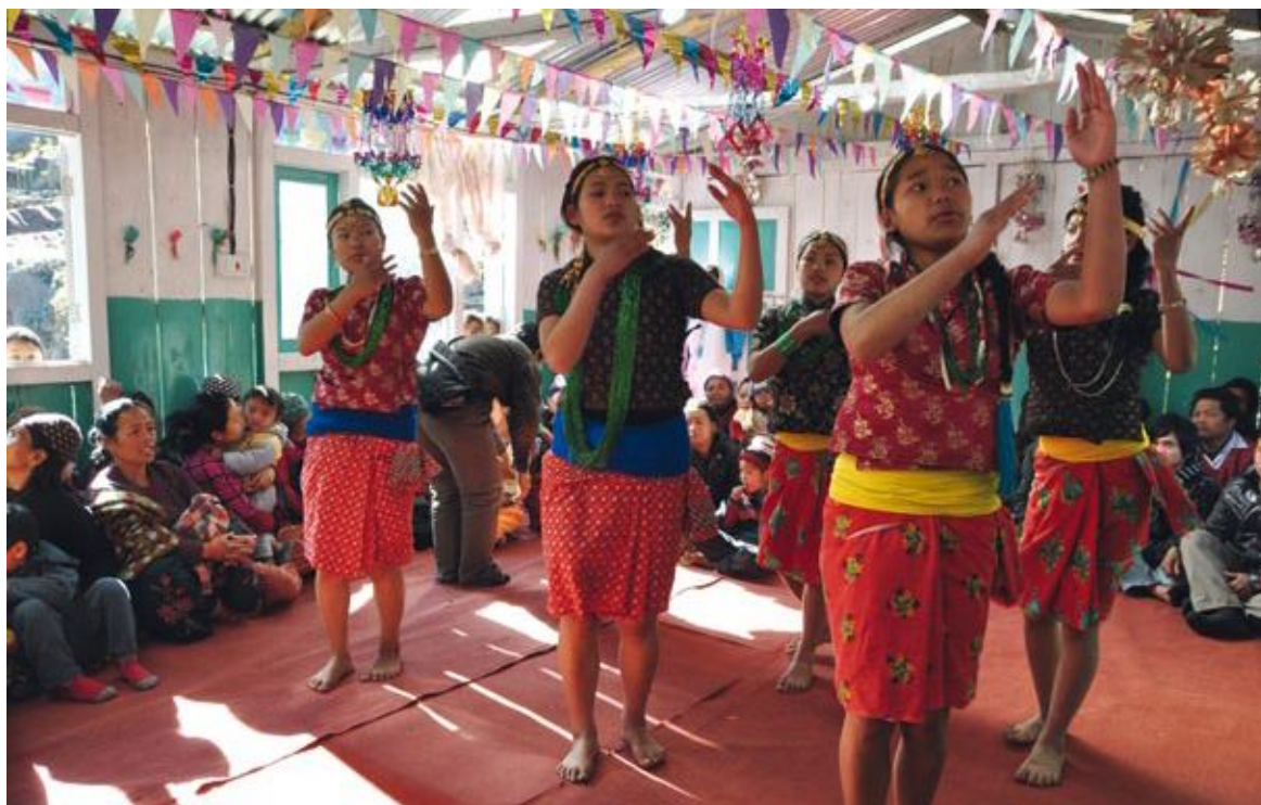
'In Nepalese kerkdiensten is er veel plaats voor aanbedding, omdat als Jezus aanbeden wordt, de demonen moeten wijken.'