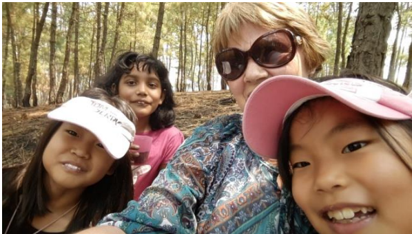
Picknick op de berg

Op Goede Vrijdag heb ik mijn linkerpols gebroken na een gezellige picknick met kinderen op een berg. Ik gleed uit tijdens de afdaling. Ik heb vijf dagen in het ziekenhuis gelegen en ben geopereerd. Er werd een stalen pin ingezet. Iedere patiënt moet dag en nacht iemand bij zich hebben om medicijnen en eten te kopen voor de zieke.