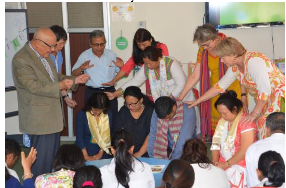
In gebed opgedragen voor hun taken